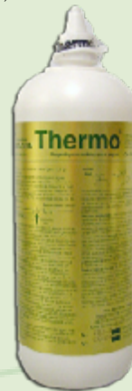
Progéstágeno sintético para yeguas.

1. Ladaga GJB, Ferraro G, Pont-Lezica F, Iribarren P, de Erausquin G.; Comparativa del efecto clínico de dos formulaciones de altrenogest en yeguas SPC en producción; 14TH Cong W.E.V.A.; Guadalajara, Mexico; (8 - 10 Oct, 2015)